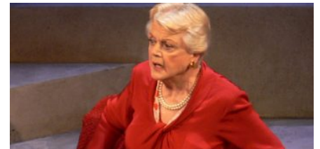
Angela Lansbury, la signora in rosso.